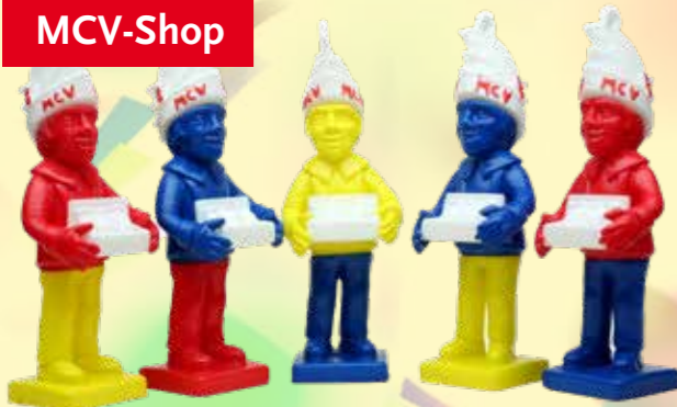
Zugplakette 2025 „Der Plakettenverkäufer“